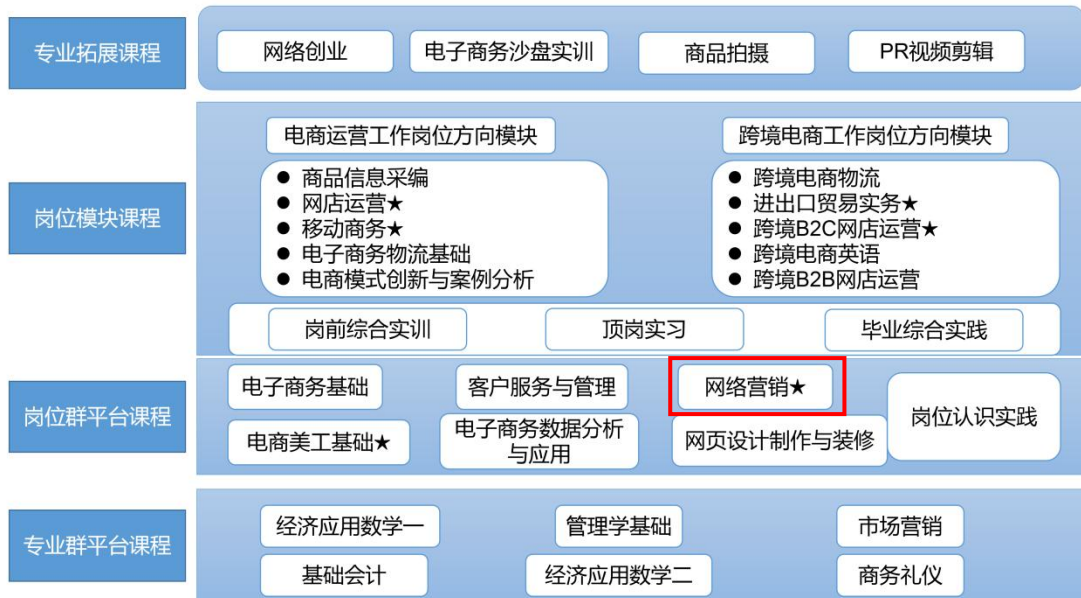
图 1 专业课程体系

专业（技能）课程由专业群平台课程、岗位群平台课程、岗位模块课程和专业拓展课四大部分组成。